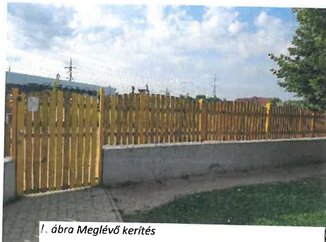
1. ábra Meglévő kerítés