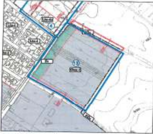
Részlet a 2013-ban hatályon kívül helyezett Szabályozási Tervből

A Kúria Önkormányzati Tanácsának 5013/2013/77 számú határozatával 2013. június 6-i hatállyal megsemmisítette a többször módosított 46/2008 (IX. 25) számú rendelettel elfogadott Helyi Építési Szabályzatot . A hatályon kívül helyezés indoka az alaprendelet véleményeztetési eljárási hibája volt, jogszabályba ütköző előírásról a Kúria határozata nem rendelkezett. Ebben a hatályon kívül helyezett Szabályozási Tervben a szóban forgó terület Ev védelmi rendeltetésű erdőterület övezetbe és Gksz-1 kereskedelmi, szolgáltató gazdasági építési övezetbe sorolt területként szerepelt .