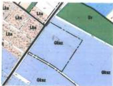
részlet a hatályos TSZT-ből

TSZT – a területek hosszabb távú hasznosítását meghatározó dokumentum. Azt mutatja, hogy az egyes területek milyen területfelhasználásra szántak, azaz milyen övezetűvé lehet szabályozni azokat.