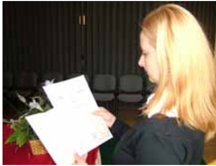
A gyermekkorban megálmodott magyar állampolgárság bizonyítéka

- Magyar állampolgárként született, aztán Erdély elcsatolása után „román lett”, majd ismét magyar állampolgárként élhetett, amit újból követett a kényszerű román állampolgárság. Időközben gyerekei áttelepültek Magyarországra, őket követte időskorára. Nagyon megható volt az eskü, itt volt a „kilencedik iksz” felé járó