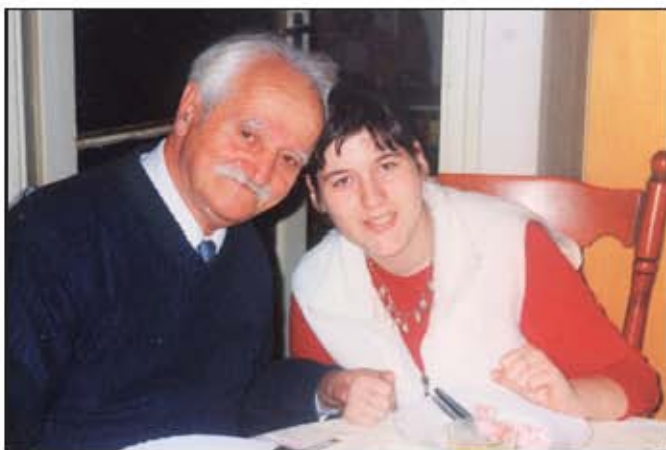
Később az egyik unokával