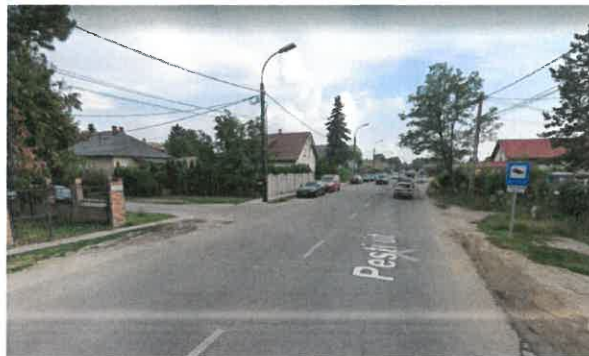
Erzsébet utcai kereszteződés a Pesti út felől mindkét irányból behajtás megengedett