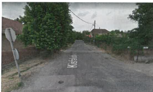
Kisfaludy utca 80-100 m hosszú