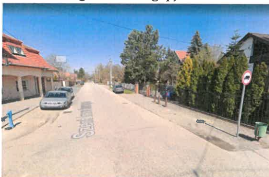
Tehergépjármű forgalom jelenlegi korlátozása Szent Imre Herceg utca Duna út felől