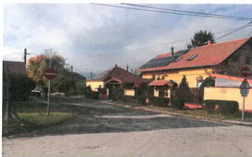
Kisfaludy utca „behajtani tilos kivéve célforgalom”