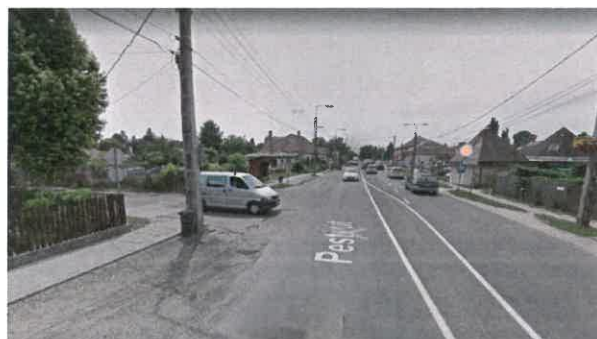
Kisfaludy utcai kereszteződés a Pesti út felől csak jobbra kisívben behajtás megengedett