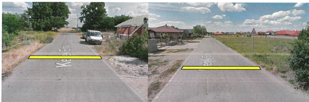
Javasolt sebességcsökkentő küszöbök (Kerek Erdő u. 43. és 54.)