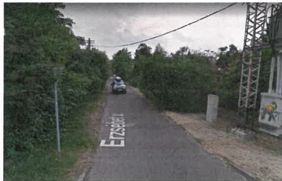
Erzsébet utca kétirányú forgalommal keskeny burkolat szélességgel