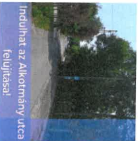
Indulhat az Alkotmány utca felújítása!