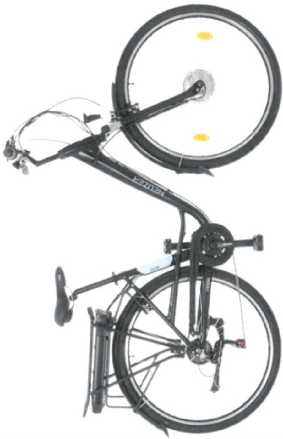
Kép 1/3 - Neuzer Zagon E Trekking MXU S6 SPD TELE SZKOPO SVILLAVAL 28-mattfete-kek