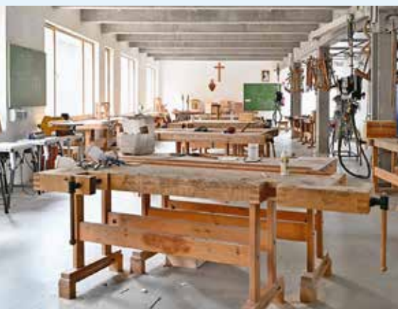
A piarista szakképző egykori asztalos-műhelyében hamarosan felső tagozatos huzellás diákok tanulnak majd

A gödi általános iskolák – különösen a Huzella Tivadar Két Tanítási Nyelvű Általános Iskola – tűzszóftaltsága szolgált alapul annak a tárgyalássorozatnak, amelyet a polgármester a Piarista Rend Magyar Tartományával, illetve a Dunakeszi Tankerülettel folytatott. Április végi döntésével a képviselő-testület támogatta a volt szakképző intézet több épületének megvásárlását, így a rendkívül értékes Duna-parti ingatlan csaknem 6500 négyzetmétere a város tulajdonába került. A Jávorka utcai területen négy épülettel és egy sportpályával gyarapodik a város ingatlanvagyonára.