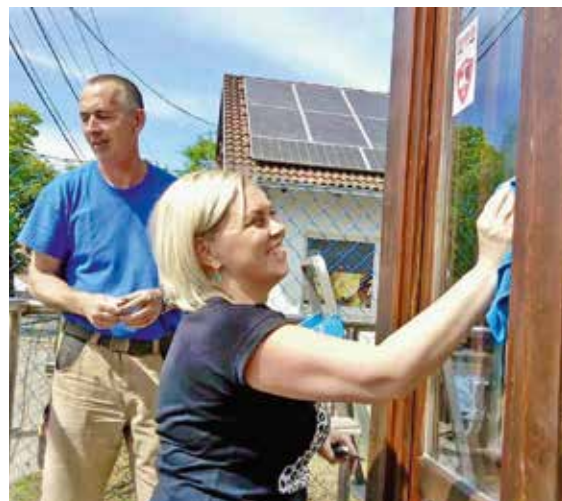
A postanyitás előtti takarításban többen részt vettek társadalmi munkában

Az útpadkák megtisztítását vállalkozó bevonásával oldják meg. A meglévő buszmegállók rendbetétele, festése is megkezdődött. Télen hideg aszfalttal végeztek kisebb kézi kátyúzásokat. Április második felében néhány fontosabb kigödrösödött földes út kézi javításának is nekiálltak, azonban a földes utak átfogó karbantartására május-júniusban kerül sor a polgármesteri hivatal szervezésében.