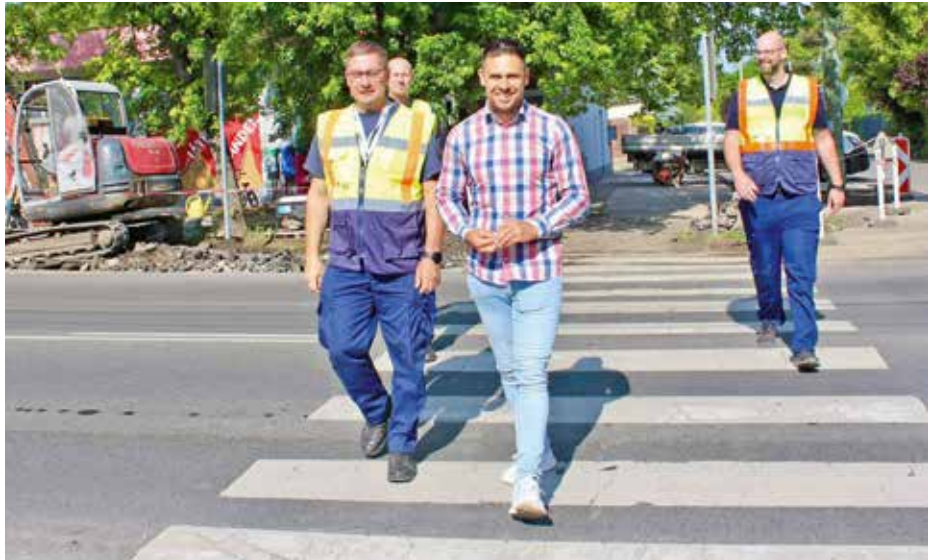
Képünkön még készült az intelligens gyalogátkelőhely a Pesti út és a Jávorka Sándor utca sarkára

Tavalyi megválasztásom óta több részletben, összesen mintegy hárommilliárd forintot nyertünk el Pest Várme-