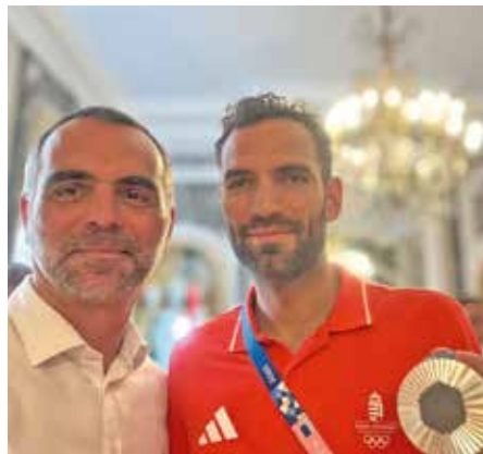
A háromszoros olimpiai bajnok vívó Szilágyi Áronnal, aki Párizsban csapatban ezüstérmet szerzett