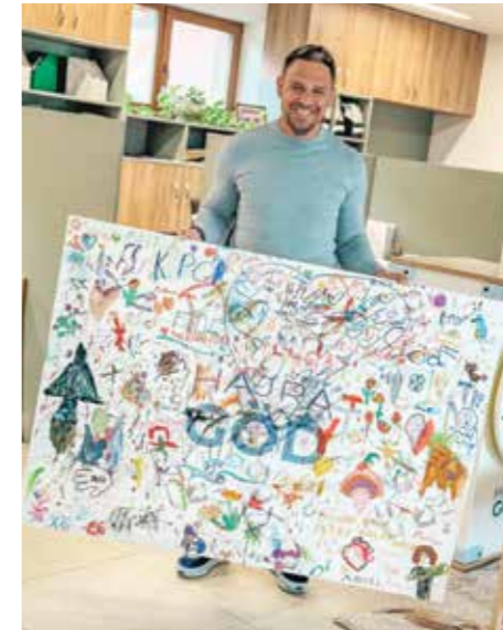
A gödi gyerekek együtt festettek egy nagy közös vászonra, mindenki hozzátette a maga kis darabját. A vidám alkotás az új ügyfélszolgálat falát díszíti majd

A sportpályákon tollasozni, röpzni, floorballozni, kispályás focizni lehetett, de volt akadálypálya, célba dobás és kötélhúzás is. Aki felmutatta a belépéskor kapott karszalagját, ingyenesen próbálhatta ki a Dunakaland kötél-ka-landpályáit, és óránként két sárkányhajóba lehetett regisztrálni 40-50 perces túrára. Közben a színpadon Mátyás király furfangos bolondjának történetét mutatta be a Maszk Bábszínpad, átmozgatott szülőket és gyerekeket a Búgócsiga Zenede, Paprikajancsi pedig Sisa Pistával küzdött meg Barta Tóni előadásában. A Gödi dallal is szórakoztatott a Nehariapura zenekar, és fellépett a 2012-ben alakult pop-rock együttes, a No Respect.