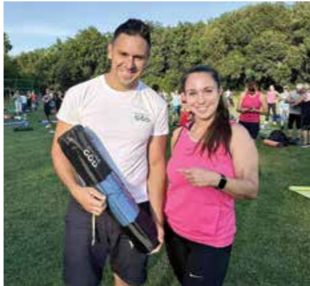
A szervezők tavaly jógamatracot osztottak ki a legaktívabb résztvevőknek. Ígérjük: idén is érdekes lesz minél több edzésen részt venni!

– Idén a tizedik évadát nyitja városunk egyik legnépszerűbb sportesemény-sorozata, és az önkormányzat ezúttal is örömmel áll a kezdeményezés mellé – mondta el a Gödi Körkép megkeresésére Kammerer Zoltán polgármester. – Tudom, hogy rengetegen várják a hírt a jó hangulatú nyáresti edzéslehetőségről, és számomra különösen is fontos, hogy minél több gödi megismerje és élvezze a rendszeres mozgás örömeit. Nem árulok el nagy titkot azzal, hogy szerintem az egészség egyik alappillére a sportolás, az aktív életmód, így mindig örömmel tölt el, ha a közösségünk számára hasznos kikapcsolódást tudunk nyújtani. Higgyék el nekem, hogy az akár 30-35 fokban együtt edzés igazi közösséggé