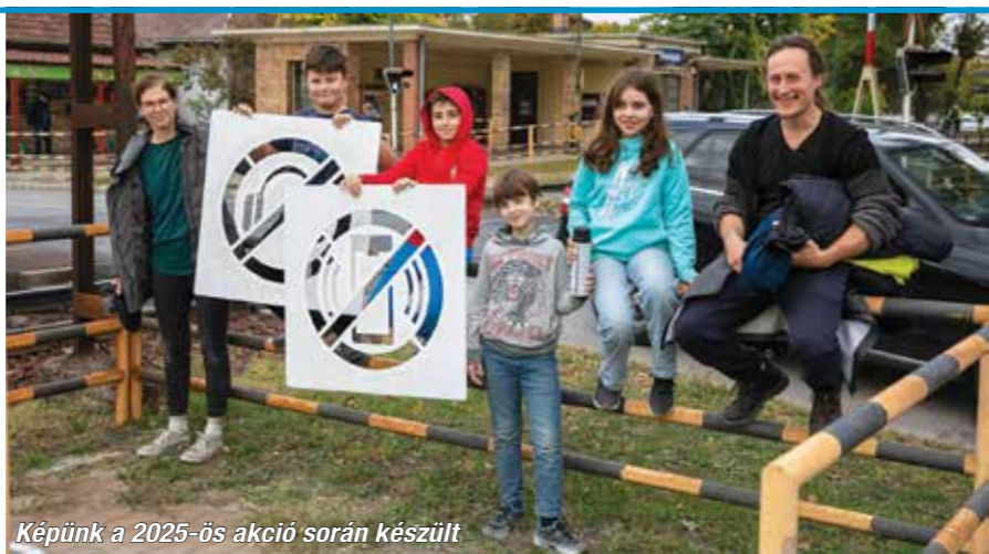
Képünk a 2025-ös akció során készült