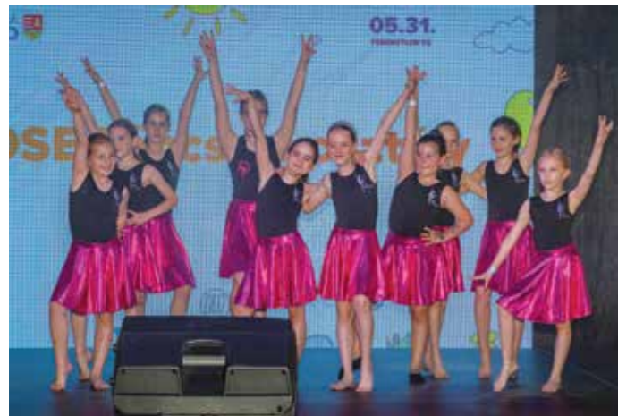
FOTÓK: BOROS FERENC