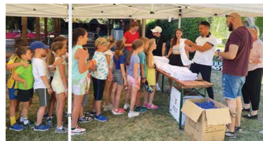
A tavalyi városi sporttábor résztvevőinek Hajrá Göd! feliratú ajándék pólóit inspirációképpen a háromszoros olimpiai bajnok városvezető dedikálta

A gyerekeket napközis rendszerben, hétfőtől péntekig 7–17 óra között fogadják a Duna-part Nyaralóházak színháztermében, napi háromszori étkezés mellett.